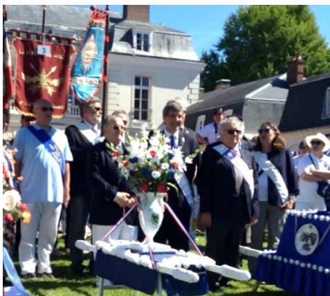
Photo prise au Bouquet Provincial de Condé-Sainte-Libiaire en 2017.