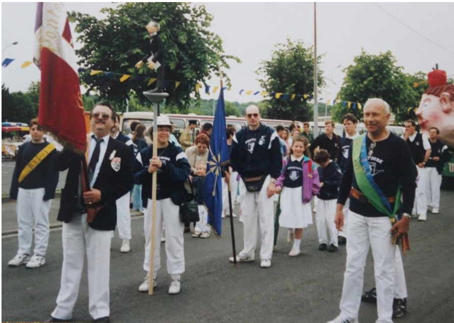
Photo prise au Bouquet Provincial de Crépy-en-Valois en 1993

Délégué élu de la Famille du Pays de France, il siègera 25 ans au Conseil de la Ronde des Familles d'Ile-de-France, depuis que celle-ci a repris ses activités en 1992 après un long sommeil depuis la seconde guerre mondiale.